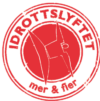
Bag Idrættslyftets beskedne logo gemmer der sig en statslig milliardssatsning på idrætstilbud til børn og unge.